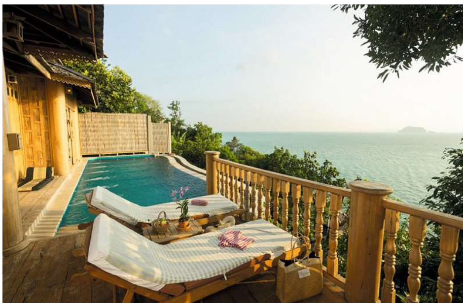
STANISLAS FAUTRE/FIGAROPHOTO - SANTHIYA HOTEL

À l'extrémité de la plage de Loh Pared, l'une des plus belles de l'île, les villas à l'architecture thaïe de ce resort s'accrochent à la falaise et sont une véritable ode à la culture locale. La décoration, entièrement en panneaux de teck sculptés, s'inspire de l'artisanat du nord de la Thaïlande. Ces luxueux bungalows de Robinson modernes disposent de piscines privées avec vue panoramique, dont la taille en fait de véritables bassins de nage. On apprécie également le spa Ayurveda où profiter d'un massage traditionnel, le nuad thaï boran, dans les règles de l'art. Une fois détendu, il faut